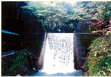
砂防ダムとその影響