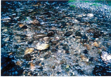
水質測定結果から見た水質