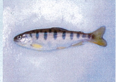
魚類から見た水質