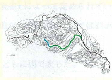
河川構造物による魚類の往来阻害