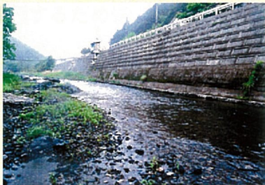
低水護岸とその影響